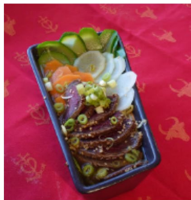
Recette de Jérôme PRAT