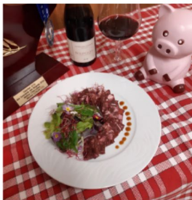
Recette de Michel COLLIN